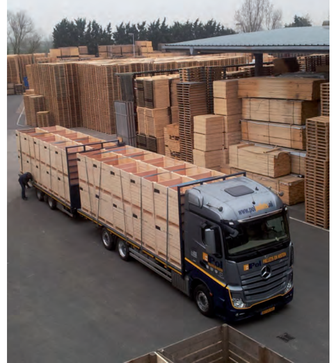
Palletbedrijf Van der Pol bereidt zich zo goed mogelijk voor.

Van der Pol kijkt vooruit: “Natuurlijk komt er een moment dat de zagerijen minder gaan produceren. In België ligt een groot deel van de zagerijen al stil en ook in Scandinavië valt het te verwachten. Als productiebedrijf zijn we verregaand geautomatiseerd, maar nog steeds staat of valt het met de beschikbaarheid van personeel. We bereiden ons zo goed mogelijk voor op ziekteverzuim, door nu door te fabriceren zodat we straks zelfs zonder productie kunnen